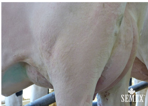
DESLACS INTEGRAL ANARICK

GLPI +2808 PRO$ 200 GP-CAN DPF RDC BLF CNF BYF CVF HH1F HH2F HH3C HH4F HH5F HH6F HCDF HMWF