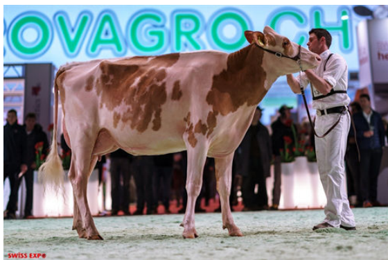
GASTLOSEN INTEGRAL LAYLANI

DYMENTHOLM S SYMPATICO *RC VAL-BISSON SHOTTLE IMELDA EX-91-6YR-CAN 11* PICSTON SHOTTLE VAL-BISSON GOLDWYN MAYA VG-88-6YR-CAN 41* BRAEDALE GOLDWYN VAL-BISSON FINLEY DREAM VG-87-6YR-CAN 14*